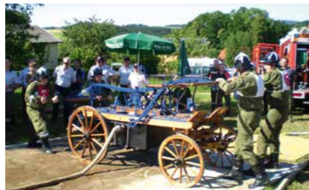
FF Wallensham – Löschanriff mit historischen Spritzenwagen