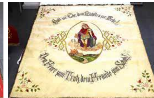
Fahne 1922 Kirchenseite

Weihe der ersten Feuerwehrfahne. Diese Fahne ist nach wie vor im Besitz der FF Brunnenthal und wird im Feuerwehrhaus aufbewahrt.