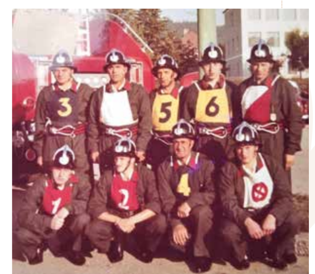
Bewerbungsgruppen in den 1970er Jahren.