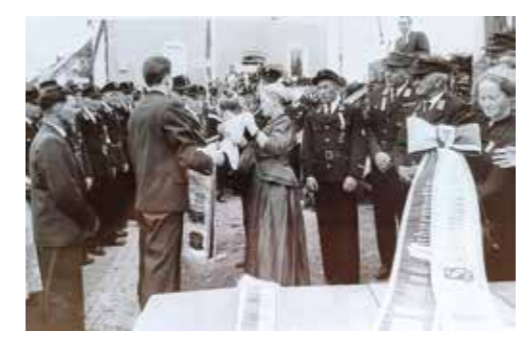
70 jähriges Gründungsfest

21 österreichische und 10 bayerische Wehren nehmen am Fest teil. Die FF Brunenthal rückt mit 82 Mann aus.