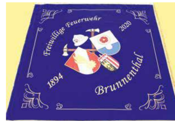
Fahne 2020 Vereinsseite

Übernahme der neuen Feuerwehrfahne. Auf dem Ehrenband befinden sich 170 Spendernägel.