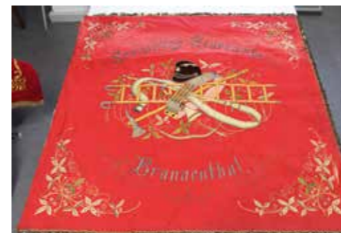
Fahne 1922 Vereinsseite