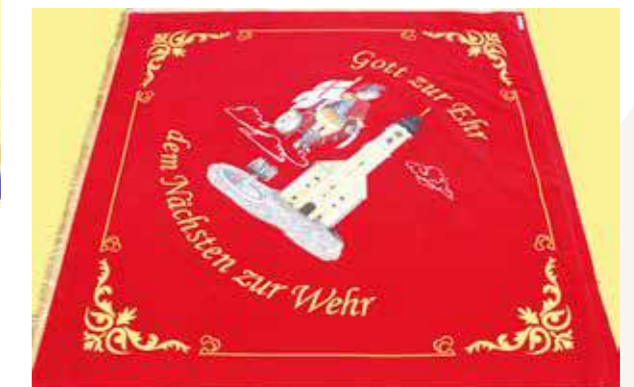
Fahne 2020 Kirchenseite