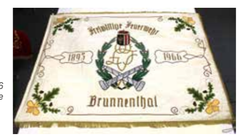
Fahne 1966 Kirchenseite