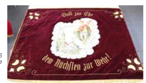
Fahne 1966 Vereinsseite